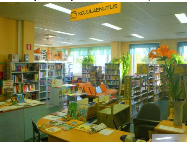
2003. aasta maist alates Jüri tn 54 2. korrusel, 1980-ndate lõpul telefoni-telegraafi majaks ehitatud hoones (590 m 2 )