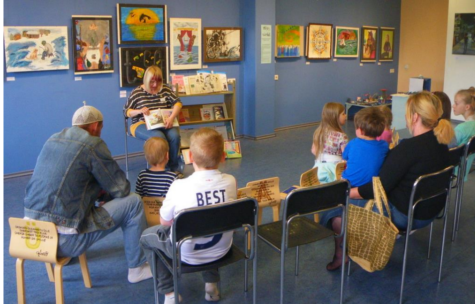
Mudilaste jutulaupäev: seebijutud. Räägime pesemisest ja meisterdame mullitaja