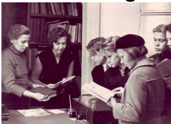
1955-1977 Kreutswaldi muuseumi kõrvalmajas (40 m 2 )