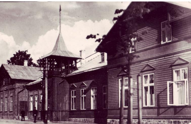
1951-1955 Kultuurimaja Kannel vana maja ühes toas (20 m 2 , kaks parempoolset akent)