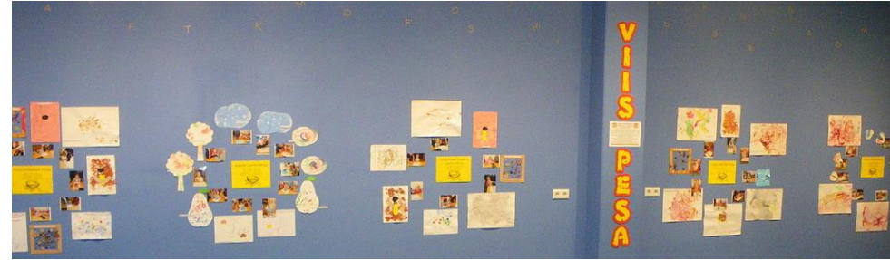
Võru Loovuskooli beebikooli 26. näitus

Kord aastas käib bibliograaf kõigis rühmatundides vanematele väikelaste raamatutest ja lugemaõppimisest rääkimas.