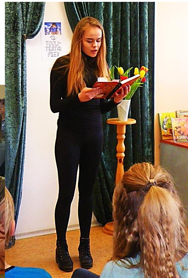
12. Tooliteatri etluskonkurss 6.-9. kl õpilastele. Loeme käesoleva aasta Eesti lastekirjanduse juubilaride proosat ja luulet