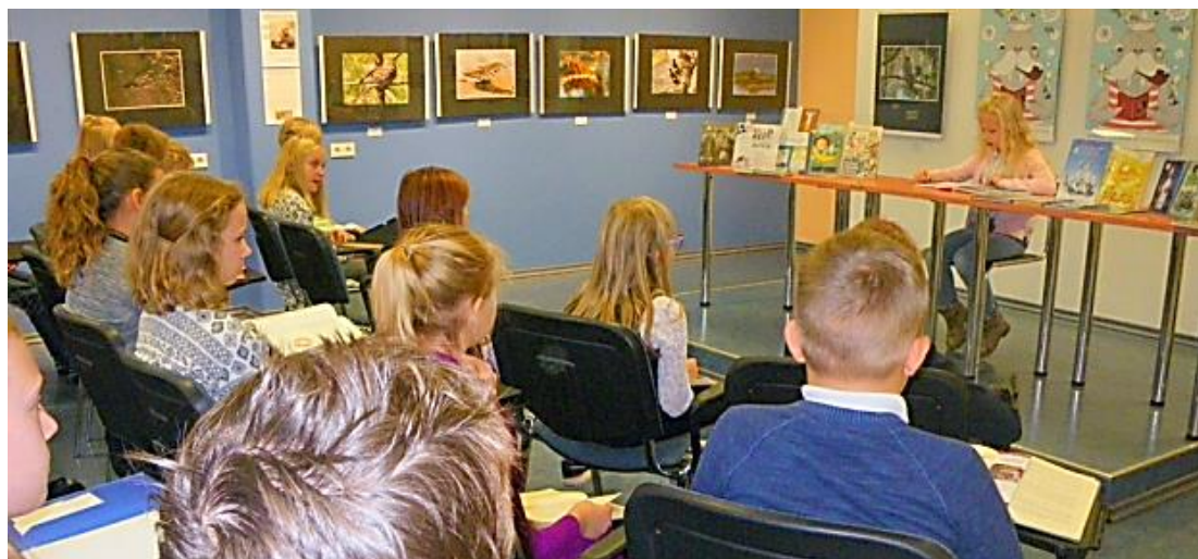
21. ettelugemise võistlus 4. kl õpilastele