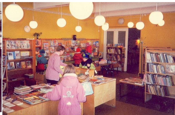
1977-2003 Kultuurimaja Kannel uue maja juurdeehituse 2. korrusel (353 m 2 )